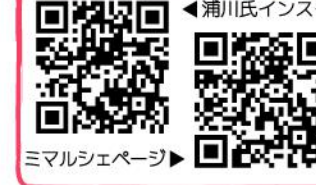
ミマルシェページ