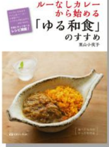
▲ルーなしカレーから始める「ゆる和食」のすすめ

ゆる和食のすすめについて、さまざまな方法で情報発信を行っています。ホームページはもちろん、LINE®など。最近では、オンライン講座も実施しています。MIMAショールームでも和つきむちの作り方講座をしました。最後、栗山先生はゆる和食を通じて、皆が健康になるように願っており「八尾