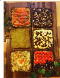
▲お砂糖なしおやつ